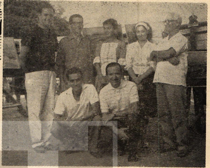
1961 IV. Erdek Şenliğinde Ressamlar birarada

Saat 18 i vurdu. Cumhuriyet Meydanına yalaş bir kayık konmuştu.